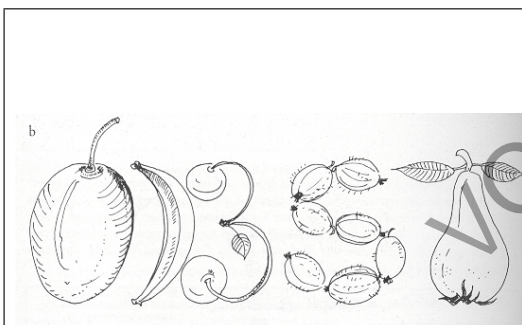
Abb. 4 (aus: Salberg-Steinhardt 1983, S. 244)

Hierbei gibt es unterschiedliche Ausprägungen: So kann das ganze Wort im Wortsinn gestaltet werden (siehe Abb. 4) oder auch nur Teile davon. Durch die Anordnung von Buchstaben können ebenfalls Wortbilder entstehen (siehe Abb. 5).