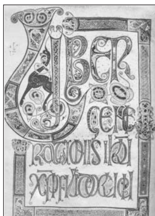
Abb. 1: Zierseite einer südenglischen Handschrift, 8. Jh. (aus: Kapr, 1983, S. 52)

Von jeher hat der Mensch versucht, die Buchstaben-schrift bildhaft zu unterstützen. So wurden einzelne Buchstaben als Initiale jahrhundertlang entsprechend gestaltet. Abb. 1 stammt aus der Karolingerzeit. In der Buchmalerei verzierten Mönche u.a. die Initialen reich mit Ornamenten und Figuren (vgl. Lexikon der Kunst, 2004, Band 3, S. 663/664). Dies änderte sich zur Zeit der Gotik: Der Initialschmuck wurde nun einfacher und erinnert mehr an geometrische Grundformen, siehe Abb. 2 (vgl. Lexikon der Kunst, 2004, Band 2, S. 813).