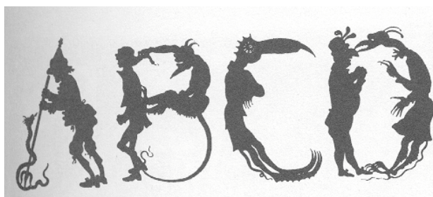
Abb. 3: Ausschnitt aus einem Teufelsalphabet, Paris 1936 (aus: Kapr, 1983, S. 201)

Auch wurden durch die Jahrhunderte immer wieder Schmuckalphabete geschaffen, deren Buchstaben in einer Vielzahl von Formen gestaltet waren (siehe Abb. 3).