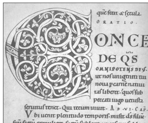
Abb. 2: Frühgotische Buchschrift. 12. Jh. (aus: Kapr, 1983, S. 68)

Auch wurden durch die Jahrhunderte immer wieder Schmuckalphabete geschaffen, deren Buchstaben in einer Vielzahl von Formen gestaltet waren (siehe Abb. 3).