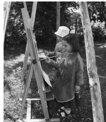
Natur erleben – mit Kunst etwas bewegen in der DRK-Kita