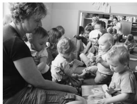
Krabbelkinder im Li-La-Laune Haus