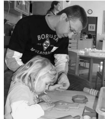
Väterarbeit in der städtischen Tageseinrichtung (TE) Bullerbü