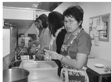
Thailändisch-Kochen in der städtischen TE Traumland