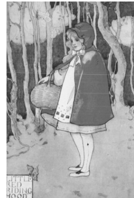
Little Red Riding Hood, illustrated in a 1927 story anthology