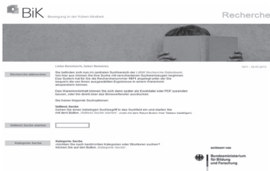
Abb. 1: Beginn der Recherche

Die Literaturdatenbank bietet pädagogischen Fachkräften und Studierenden in Studiengängen zur Pädagogik der frühen Kindheit verschiedene Möglichkeiten einer umfassenden Literaturrecherche zu sämtlichen Aspekten von „Bewegung in der frühen Kindheit“, die in diesem Umfang bisher nicht vorhanden war. Um besonders viele NutzerInnen anzusprechen, ist in der LitBiK Literatur für die Bereiche Theorie und Praxis eingestellt worden. Mithilfe verschiedener Suchoptionen wie Kategoriesuche und Volltextsuche lassen sich detaillierte Literaturangaben zu allgemeinen wie auch sehr spezifischen Fragestellungen anzeigen. Die Volltextsuche ermöglicht es, sich durch die Eingabe von Schlagworten, Autorennamen, Buchtiteln etc. entsprechende Literatur anzeigen zu lassen. Es kann auch eine Trefferliste erstellt werden, wenn die Angaben nicht vollständig sind.