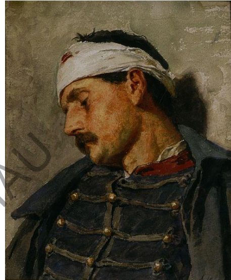
Albert Anker – „Verwundeter Soldat“ (vermutlich um 1870)

Die verschiedenen Epochen prägen natürlich auf ihre Art die jeweiligen Gedichte. Ganz allgemein lässt sich Kriegsliteratur aber zumeist der politischen Lyrik zuordnen, da durch die Darstellung des Kriegs auch politische Ideen, Themen oder Ereignisse thematisiert werden. Nicht selten lesen sich die Gedichte kritisch oder anklagend in Bezug auf zeitgenössische Machthaber oder den Krieg. Es gibt jedoch auch zahllose Beispiele, in denen der Leser sich zum Krieg geradezu angespornt fühlen kann.