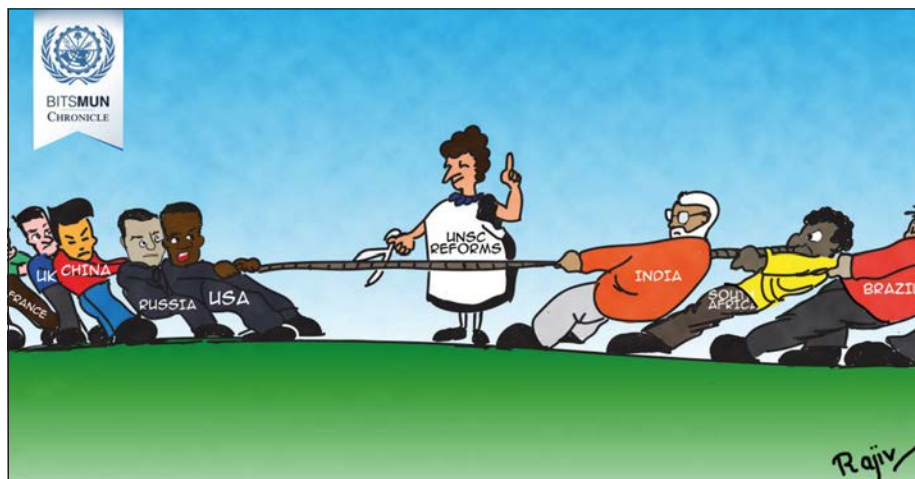
(Abb. aus: https://bitmunhyd.files.wordpress.com/2015/09/unsc-cartoon-01.jpg?w=1200 )

Kritiker werfen der UNO strukturelle Defizite vor: So sei die Architektur des Sicherheitsrats nicht dazu geeignet, tatsächlich gemeinwohlförderliche Entscheidungen zu treffen. Den Veto-Staaten werde es zu leicht gemacht, im Sinne ihrer eigenen Interessen wichtige Resolutionen zu blockieren. Zusätzlich wachsen die Herausforderungen durch neue Konfliktformen etc.