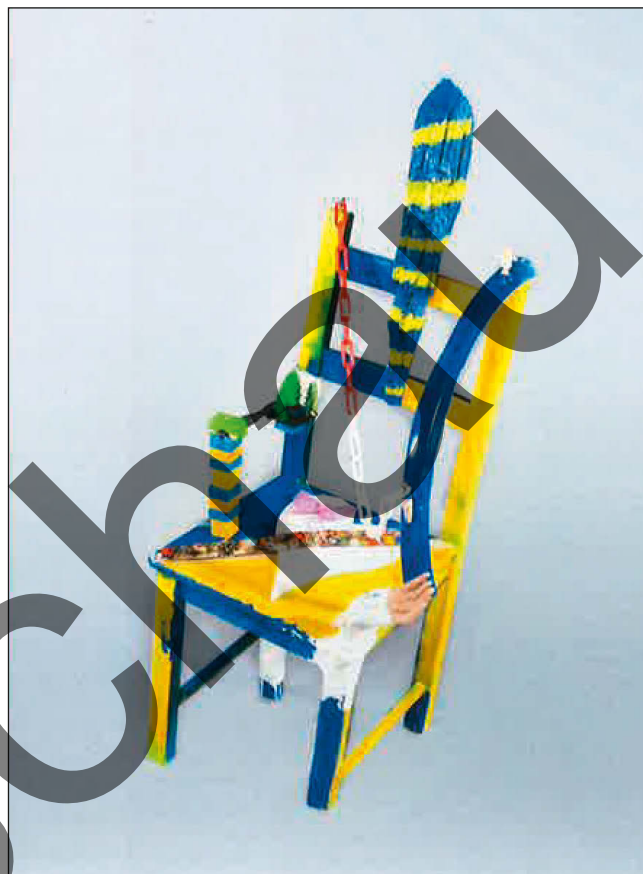
© Caritas Würzburg, Kunstaktion „Nimm Platz“, CRASH

(Jean Améry, Hand an sich legen – Diskurs über den Freitod, Stuttgart 1976)