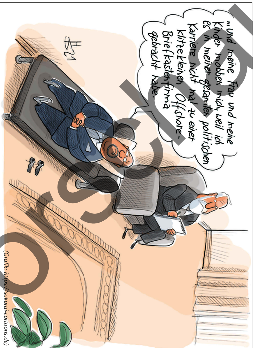
Wie die Pandora Papers Reputation zerstören