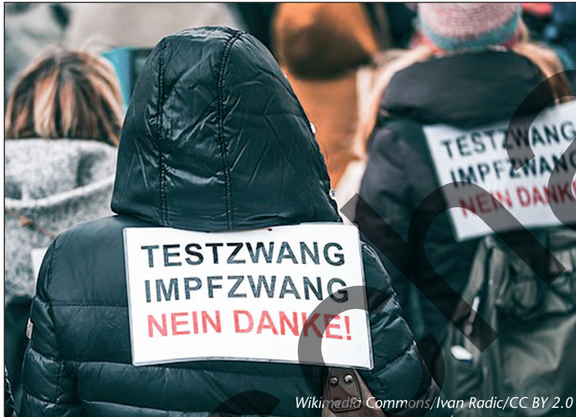
Anti-Corona-Demonstranten gegen Testzwang und Impfwang

Sie stellten die Autoritäten ihrer Zeit infrage und präsentierten sich als letzte Verfechter der wichtigsten Werte: Zur Zeit der Pest sorgten fanatische Christen für Aufsehen. Die verhältnismässig milde Corona-Pandemie vermag ähnlich heftige Erregungszustände auszulösen: Was sagt das über unsere Gesellschaft?