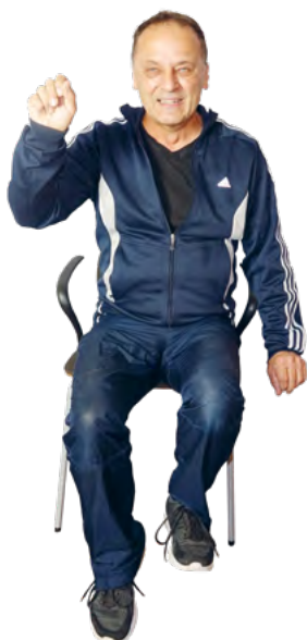
Wir marschieren in unsere Werkstatt.

1.–7. Wer will fleißige Männer sehn, der muss zu uns nach Hause gehn. Echte Männer kennen sich aus mit Werkzeug für das Haus. Schau, sie hämmern, hämmern, hämmern, hämmern, hämmern, hämmern, hämmern. Ja, sie hämmern mit 'nem Hammer auf 'nen Nagel rum. Ja, sie hämmern, hämmern, hämmern, hämmern, hämmern, hämmern, hämmern. Ja, sie hämmern auf 'nen Nagel rum.