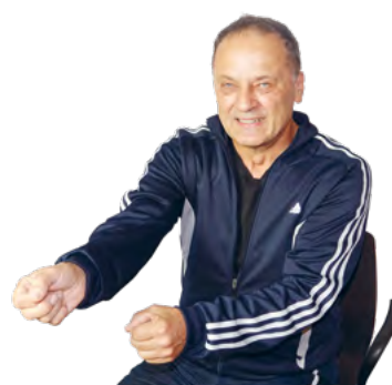
Wir marschieren in unsere Werkstatt und sägen wahlweise mit dem linken, rechten oder beiden Armen gleichzeitig.