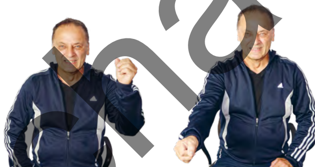
Wir hämmern wahlweise mit dem linken, rechten oder beiden Armen gleichzeitig.

Wer will fleißige Männer sehn... Schau, sie sägen, sägen, sägen, sägen, sägen, sägen, sägen. Ja, sie sägen mit der Säge auf 'nem Brett herum. Ja, sie sägen, sägen, sägen, sägen, sägen, sägen, sägen. Ja, sie sägen auf 'nem Brett herum.